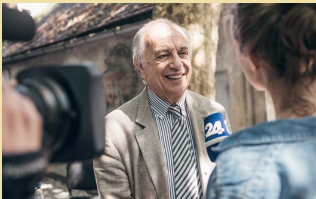
Intervju z baritonistom Leom Nuccijem