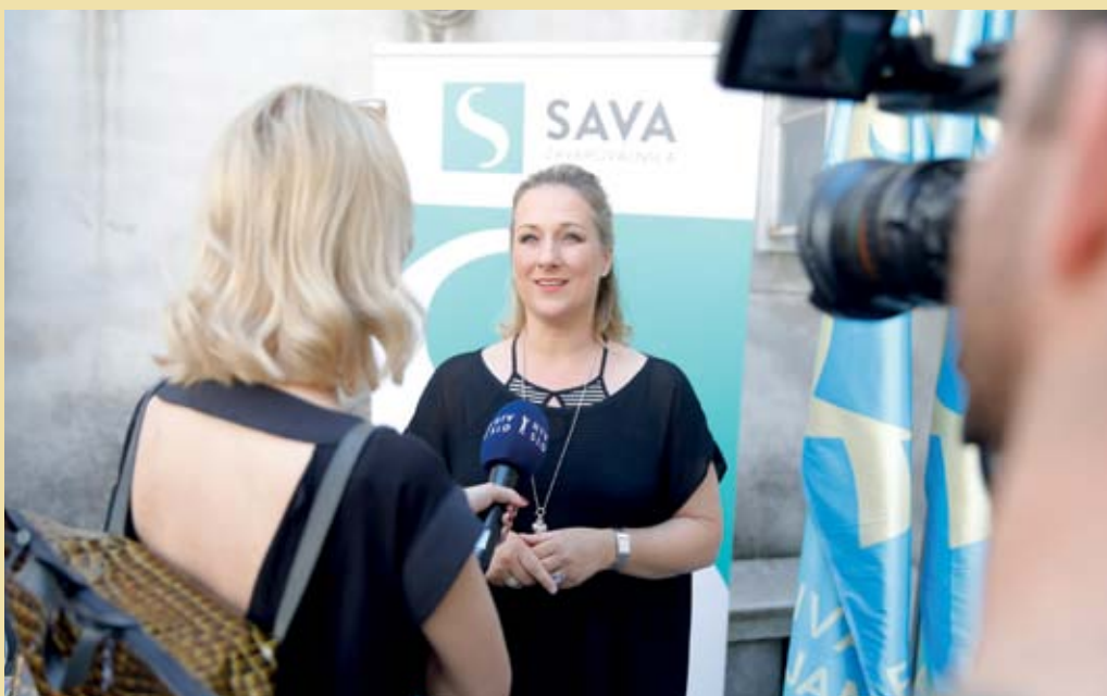
Intervju s sopranistko Diano Damrau