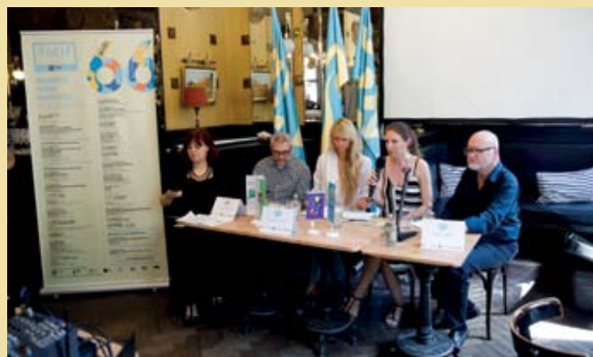
Tiskovna konferenca v Cafféju San Marco v Trstu