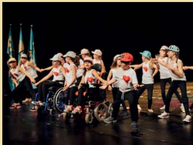
Plesno-gledališki performans Predani korakom

Festival Ljubljana je v sklopu otroških poletnih delavnic že tretje leto zapored pripravil tudi plesno-gledališki performans Predani korakom. S prebujanjem od