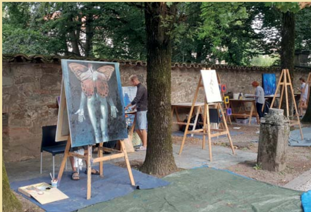
XXI. Mednarodna likovna kolonija