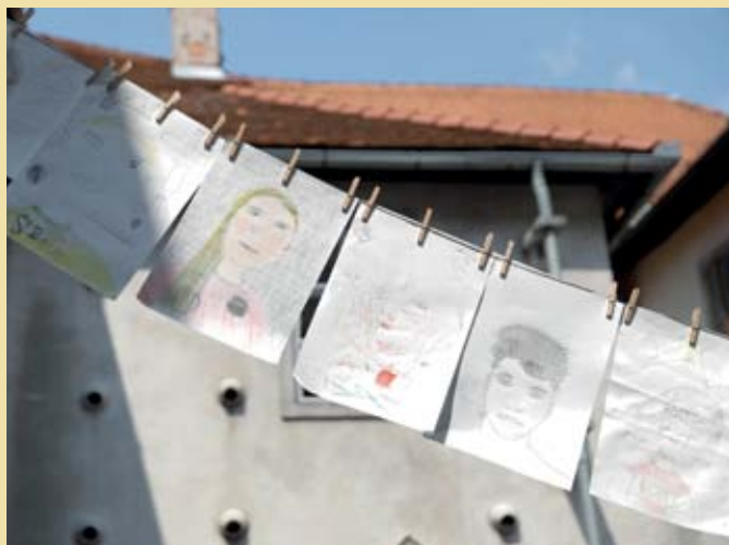
Mala likovna kolonija

Ustvarjalne delavnice za otroke so postale del festivalske tradicije. Spodbujajo domišljijo, približujejo glasbeno-umetniško ustvarjanje in širijo kulturno obzorje. Ker so brezplačne, hkrati dajejo možnost udeležbe tudi otrokom iz socialno šibkega okolja. Sponzorji delavnic so bili Zavarovalnica Triglav Mladi upi, Spar Slovenija in Zavarovalnica Sava. Delavnice za otroke, stare od 6 do 14 let, so bile sestavljene iz dveh sklopov: Eko poletje na Festivalu Ljubljana (Mala likovna kolonija) in projekt Predani korakom (gledališko-plesna delavnica). Otroke so izobraževali slovenski umetniki, slikarji, plesalci in glasbeniki. Delavnice so se končale s predstavitvijo