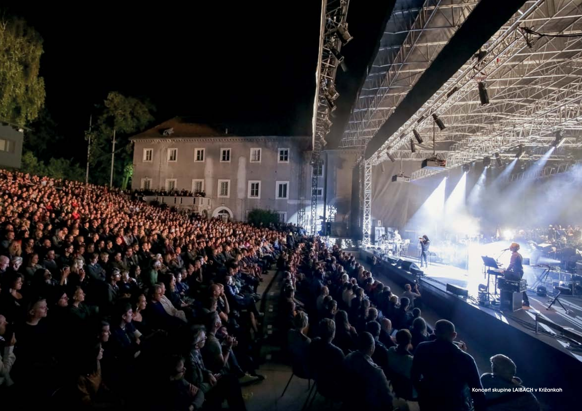
Koncert skupine LAIBACH v Križankah