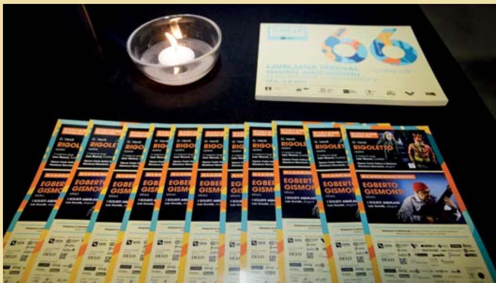
Promocijski material 66. Ljubljana Festivala