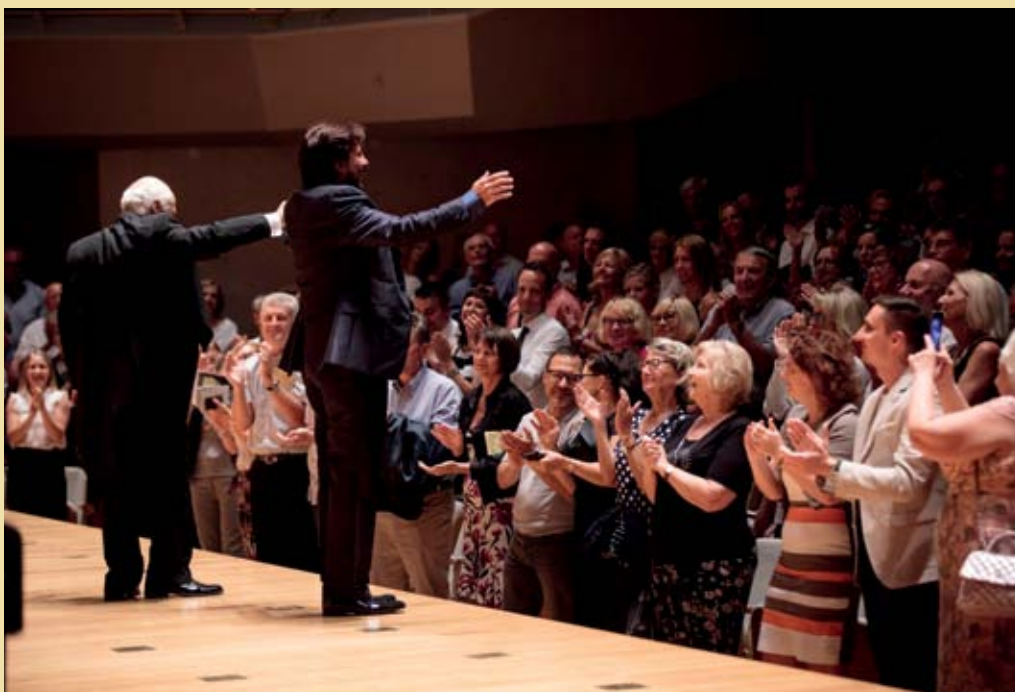
Tenorist Marcelo Álvarez je na koncertu v Cankarjevem domu požel stoječe ovacije.