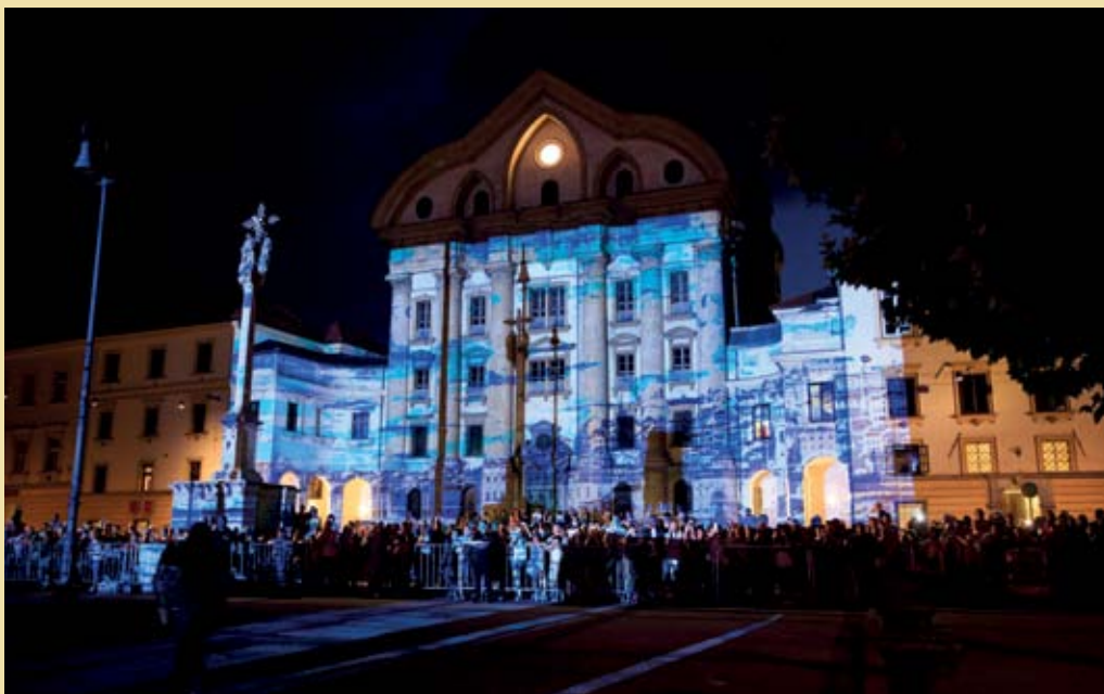
Sfera Mundi – Potovanje okrog sveta na Kongresnem trgu