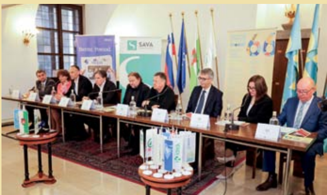
Tiskovna konferenca v Rdeči dvorani Mestne hiše v Ljubljani