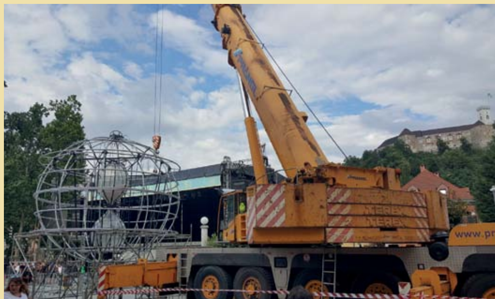
Zahtevna priprava scenografije za otvoritev