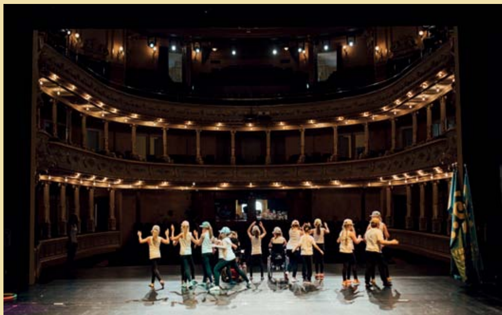
Projekt Predani korakom v SNG Opera in balet Ljubljana