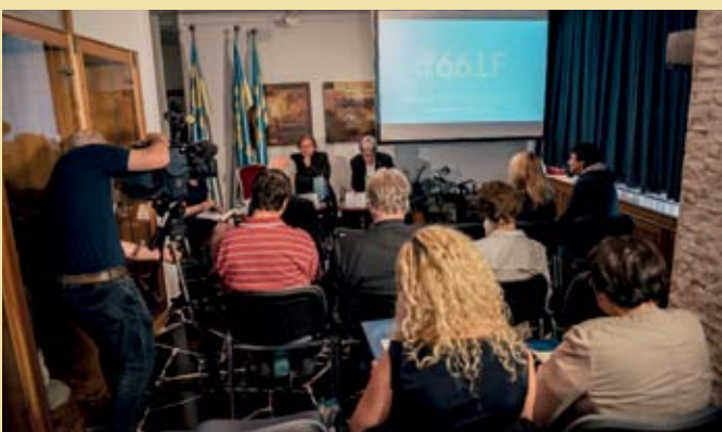
Tiskovna konferenca na generalnem konzulatu Republike Slovenije v Celovcu