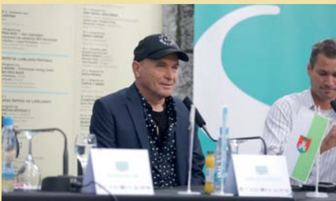
Tiskovna konferenca z režiserjem Carlusom Padrisso