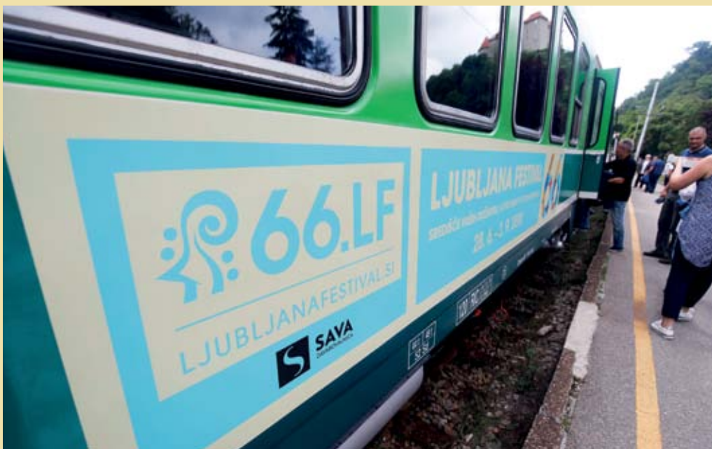
Tiskovna konferenca na gradu Rojhenburg, kamor smo se odpravili s Festivalovim vlakom.