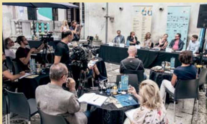
Tiskovna konferenca na Peklenskem dvorišču