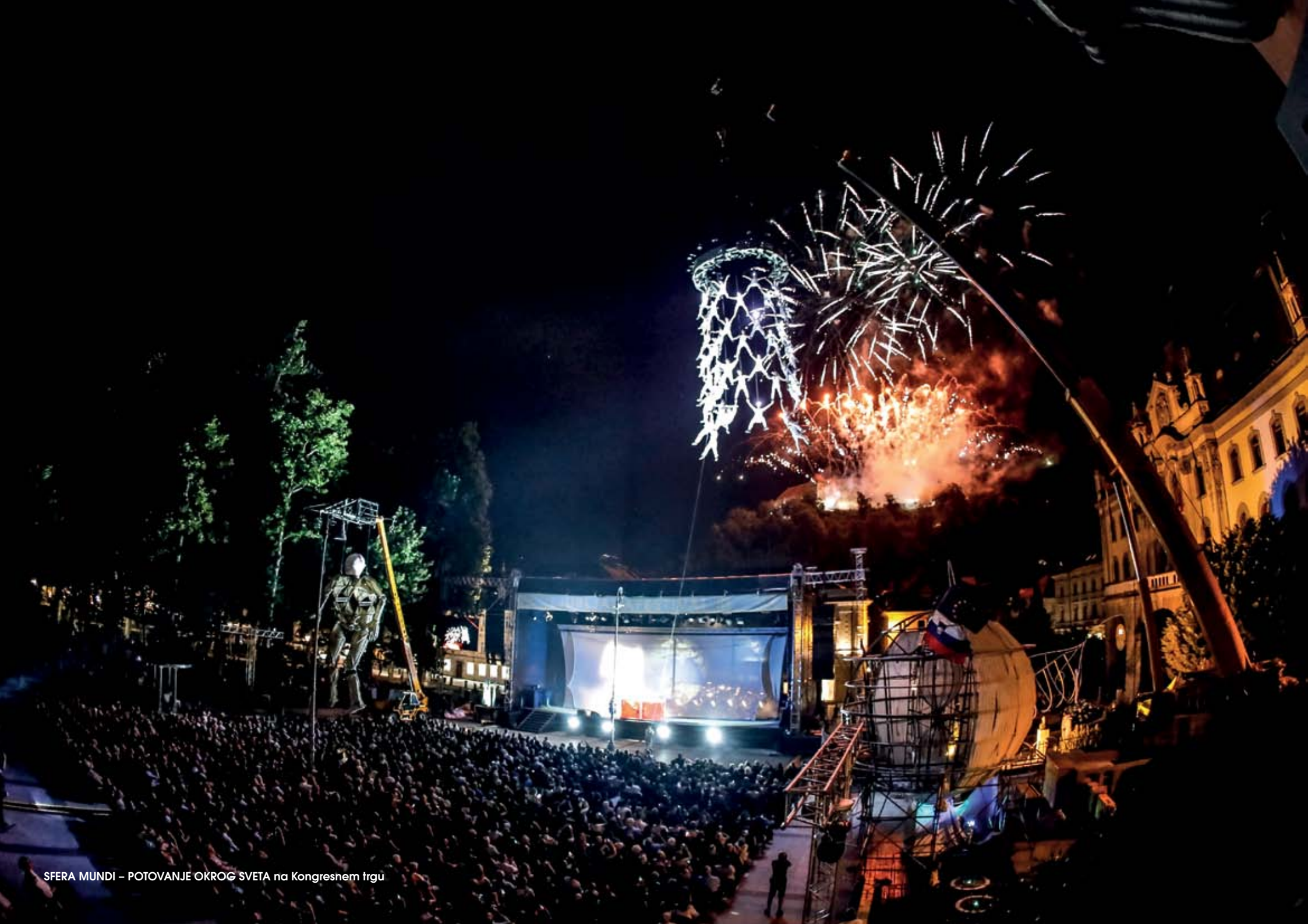
SFERA MUNDI – POTOVANJE OKROG SVETA na Kongresnem trgu