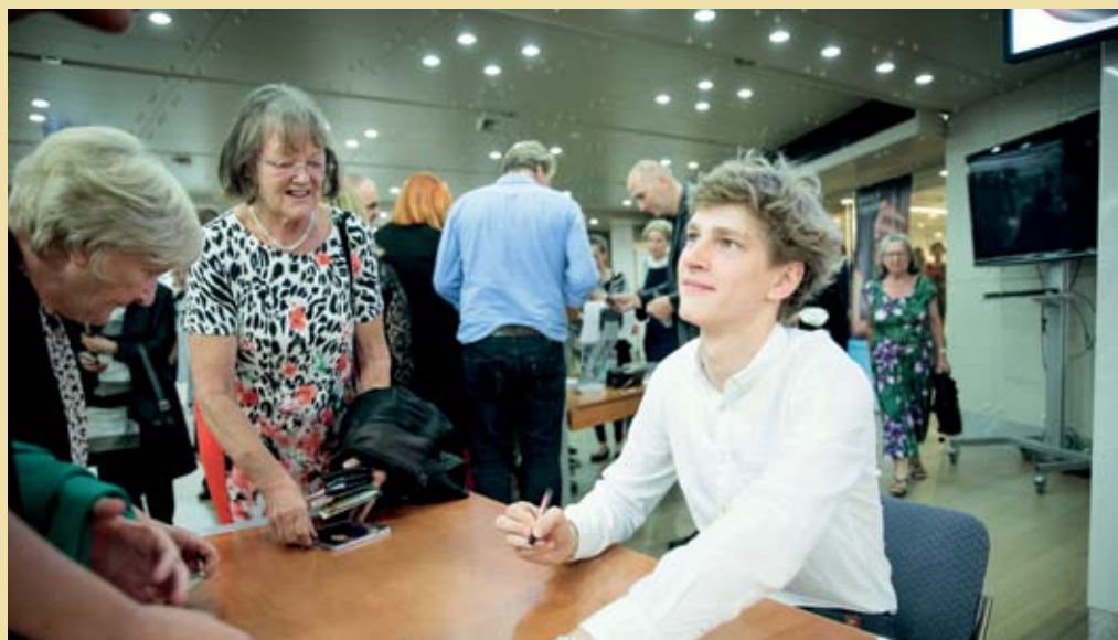
Pianist Jan Lisiecki podpisuje zgoščenske po koncertu.