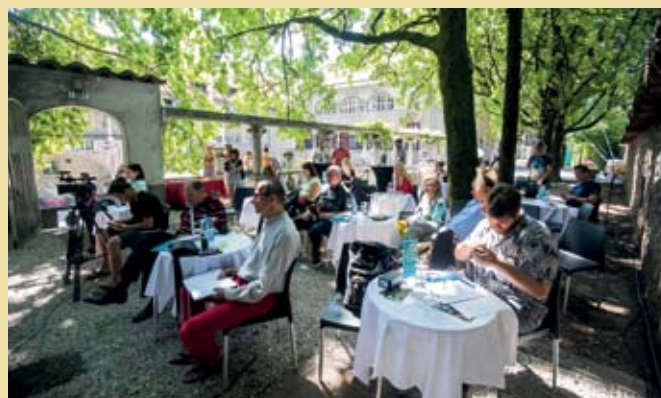
Tiskovna konferenca na Pergoli