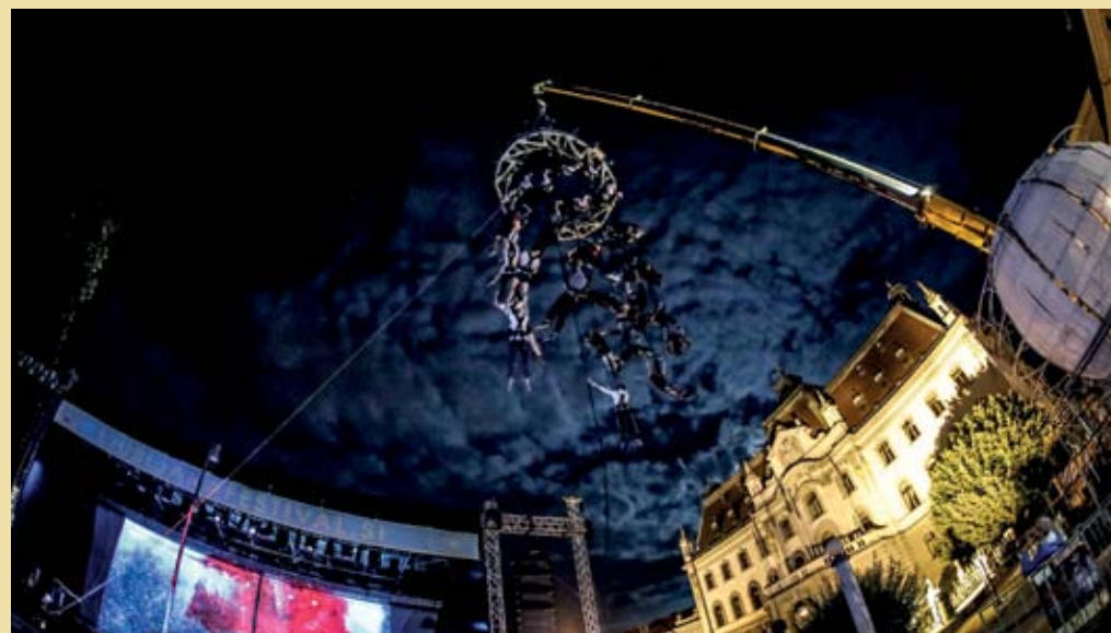
Sfera Mundi – Potovanje okrog sveta